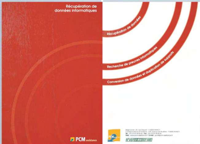
Plaquette - Recto